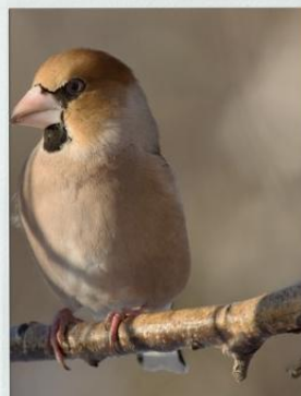
Lidia Wyleżek świetlica