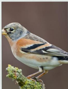
Ewelina Pabian n. wspomagający